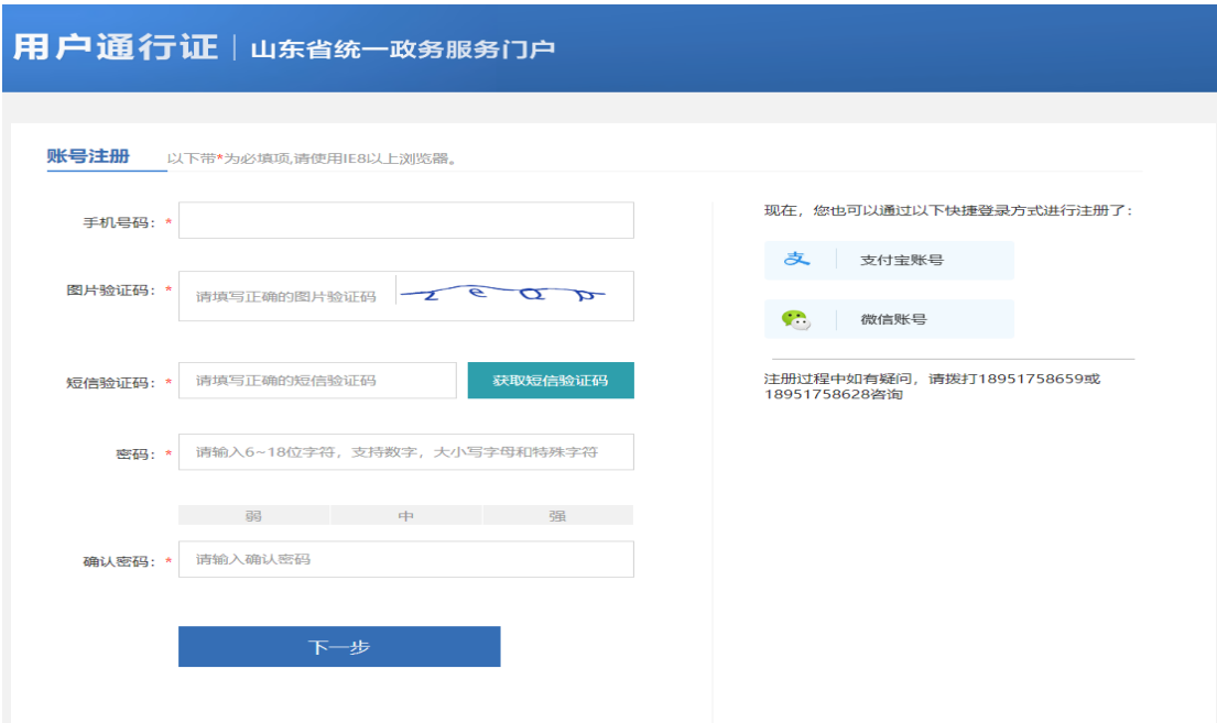
申报用户注册页面