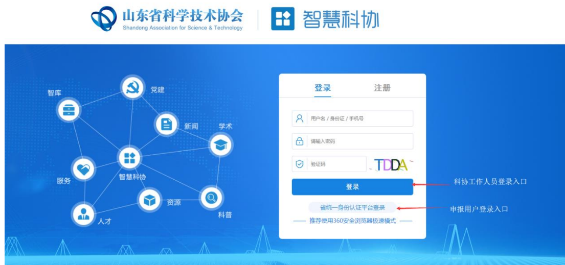
业务系统登录页面