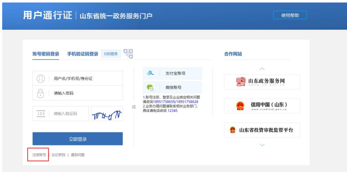
申报用户登录页面

未在“省统一平台认证登录”注册账号的申报用户，需要点击上图所示的“注册账号”进行账号注册，新用户注册页面如下图所示：